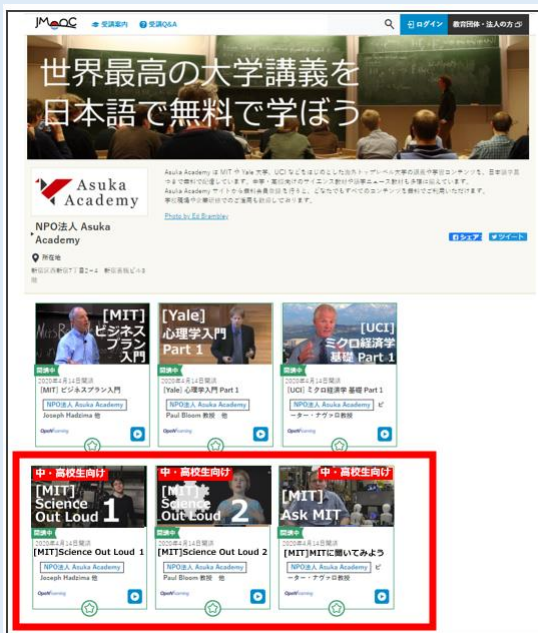
図2：JMOOCのWEBサイトから無料申込可能